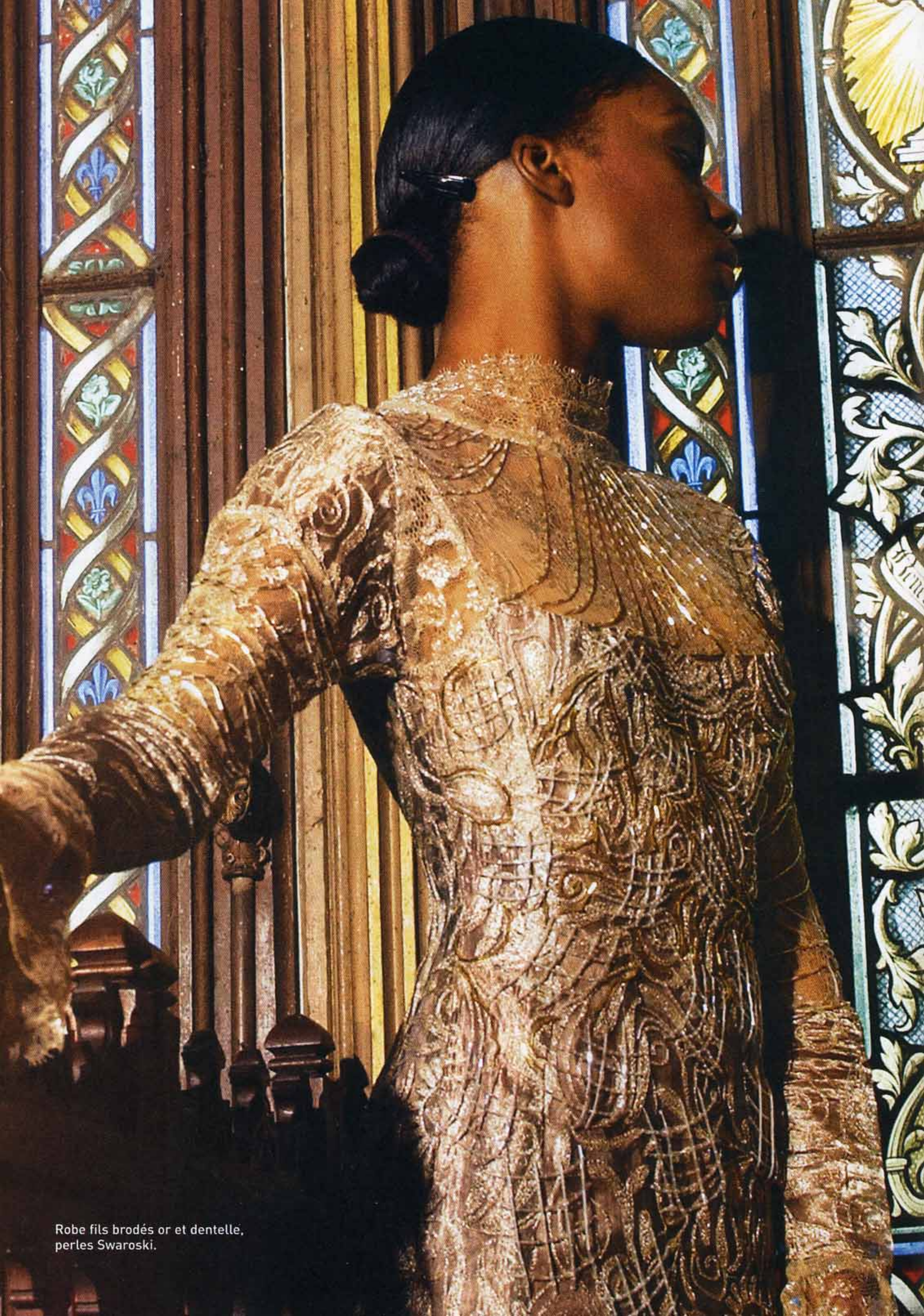
Robe fils brodés or et dentelle, perles Swarovski.