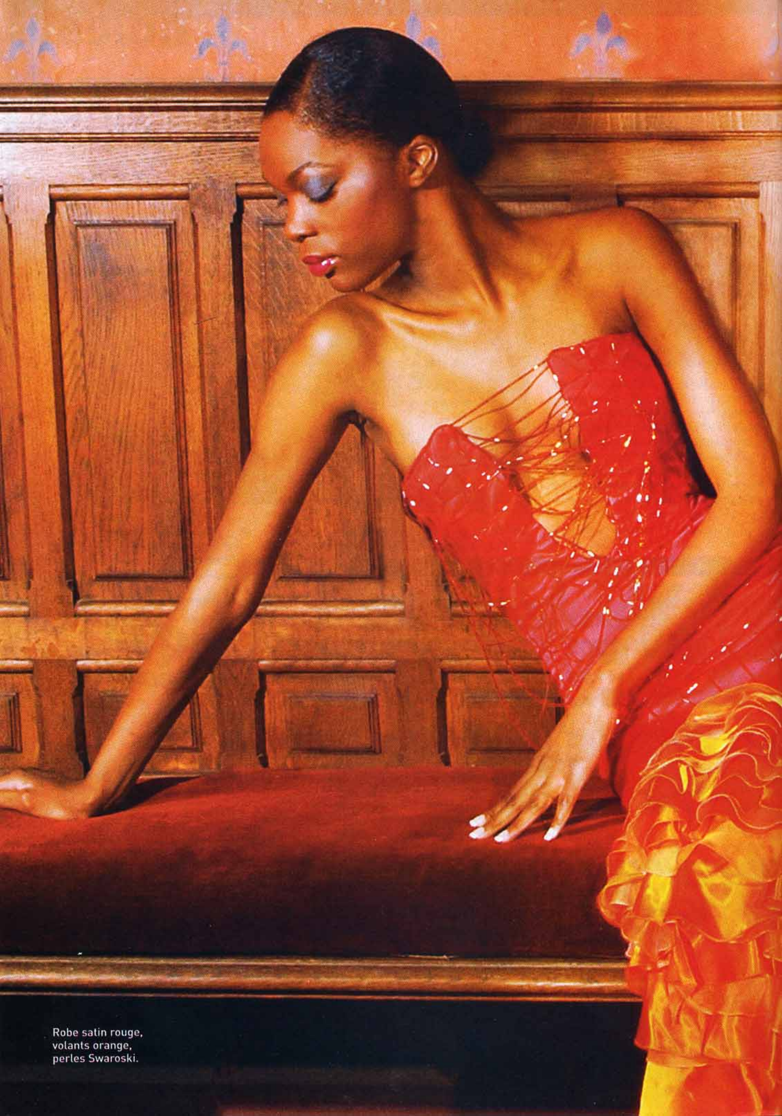
Robe satin rouge, volants orange, perles Swaroski.